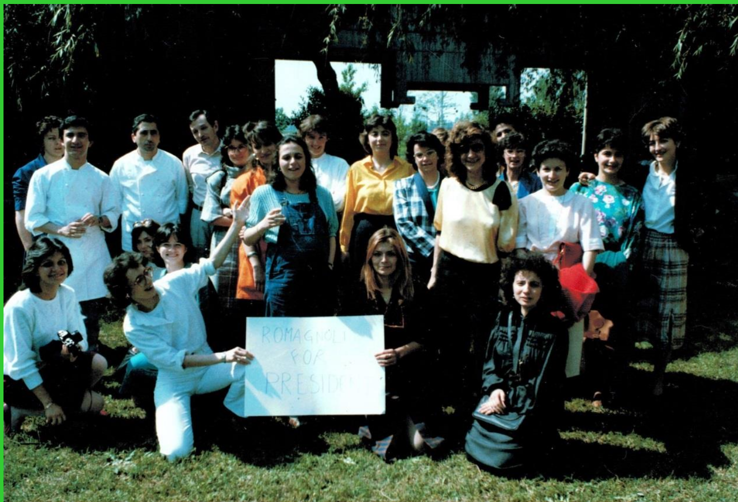
Prima Riunione delle Alumnae Domenica 11 maggio 1986