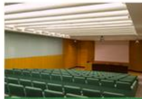
CULTURA E ACCADEMIA