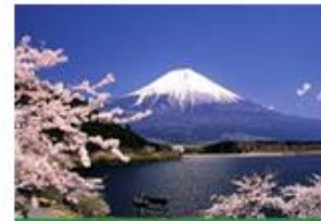
ALL'ESTERO CON NOI