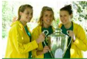
VIVERE IN COLLEGIO