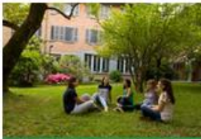
IL COLLEGIO NUOVO