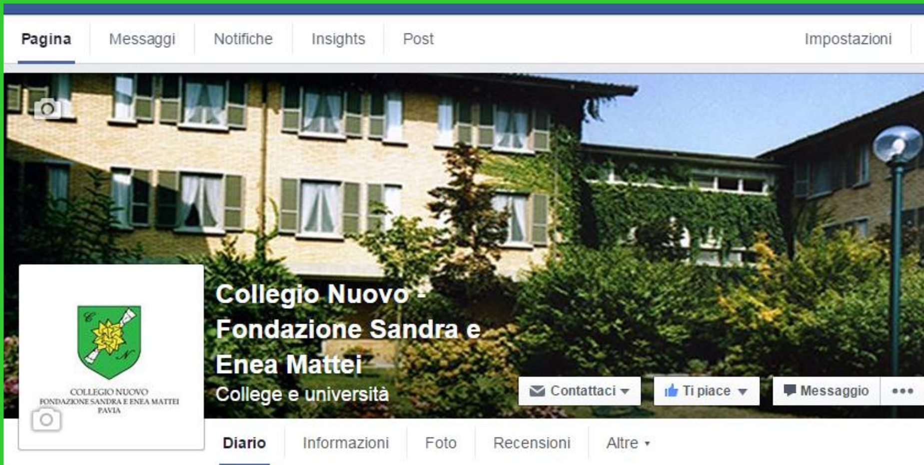
La pagina Facebook Collegio Nuovo - Fondazione Sandra e Enea Mattei