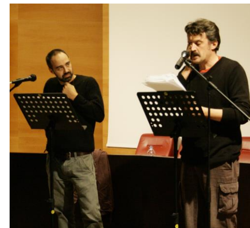
Niccolò Ammaniti e Antonio Manzini